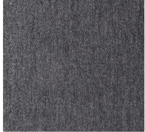
Světle šedá (příplatková)